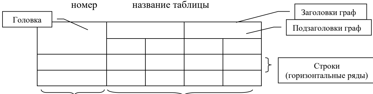
Таблица _____ - _____ номер название таблицы

Таблицы должны быть по возможности размещены так, чтобы их чтение было возможным без поворота работы или с поворотом ее на 90 градусов по направлению движения часовой стрелки. Данные, приводимые в таблицах, следует связывать с текстом работы. Допускается помещать таблицу вдоль длинной стороны листа.